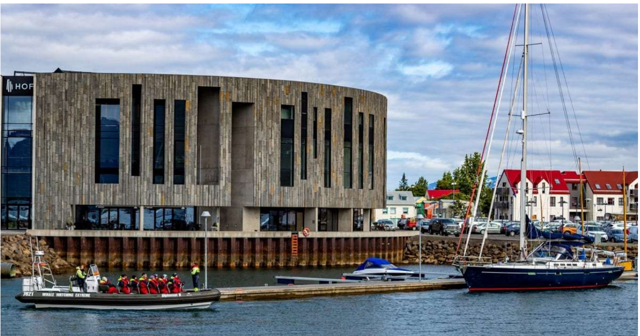
Akureyri et son centre culturel

Dîner et nuit dans la région d'Akureyri, à l'hôtel Natur ou similaire.